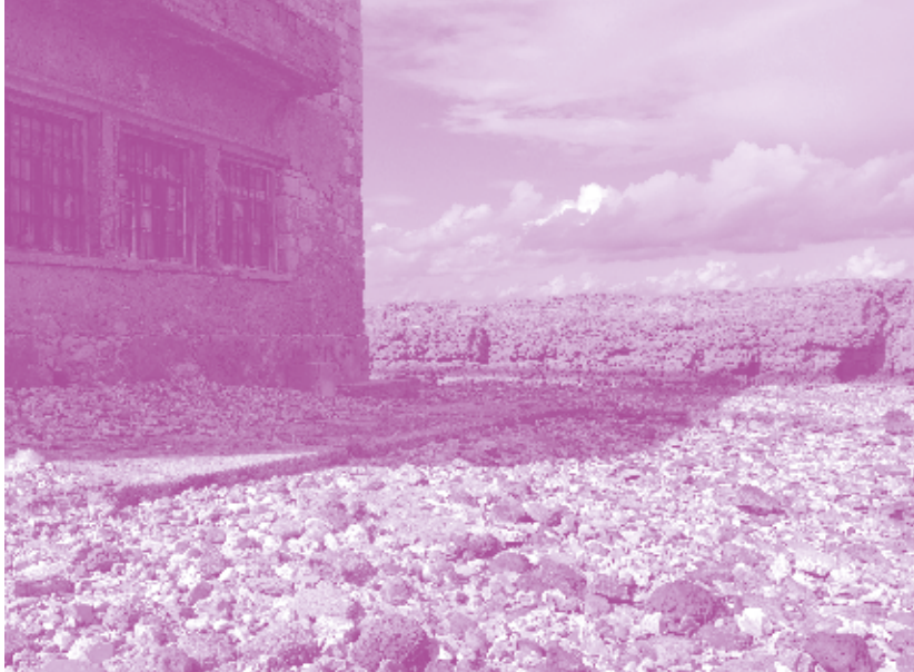
ΒΥΡΣΑ, ΟΣΤΡΑΚΑ ΚΑΙ ΑΛΛΑ ΚΕΛΥΦΗ